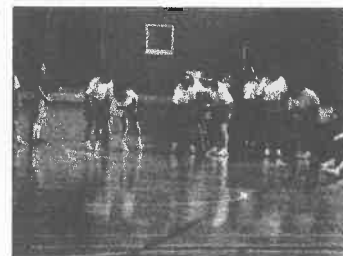
借り物競争の様子

7月16日(火)の6限に学年レクが行われ、体育館で借り物競争を行いました。一生懸命お題に該当する友達を探したり、全速力でコースを駆け抜けたりする姿が見られました。また、大きな声で友達を応援する姿も見られました。学年レクを通して大いにクラスの絆が深まりました。2学期、3学期も大きな行事があります。いろいろな行事で、その絆を強くして欲しいと思います。