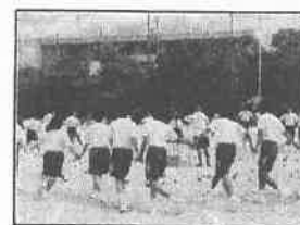
玉入れの練習の様子

10月3日(木)に体育大会が行われます。出場する競技や、各クラスの応援、係の仕事など、それぞれの役割を見つけ、一人一人が自分の役割に真剣に取り組む体育大会であってほしいと思います。また、体育大会に向けて、先日総合練習が行われ、各種目、ダンシング玉入れなどの練習を行いました。本番でもクラスの団結力が発揮できるよう一生懸命取り組んでほしいと思います。ぜひ、保護者の方のご参観をお待ちしています。