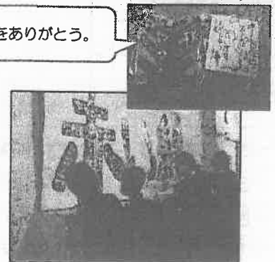
メッセージを見る3年生